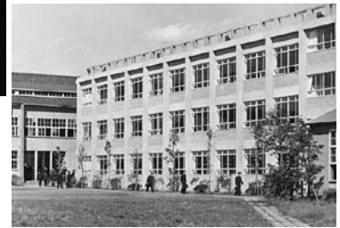
慶太翁とゆかりの深い、本学最初の鉄筋コンクリート校舎（右側の建物、3階建て旧2号館。設計：蔵田周忠、昭和30年）